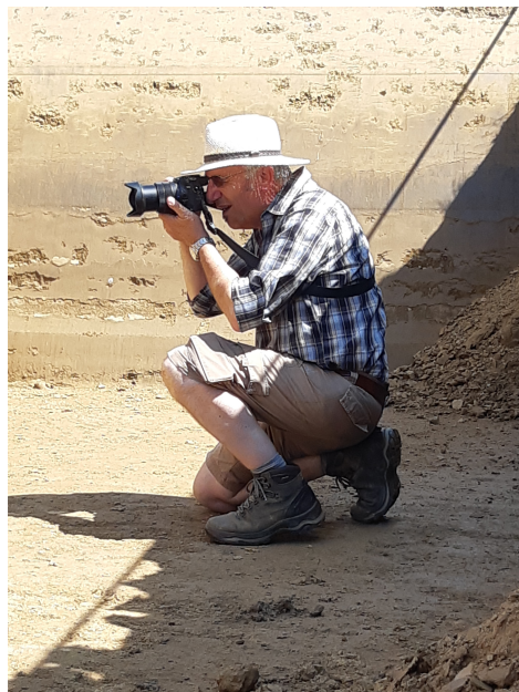
Fotograaf Wil legt profiel nauwkeurig vast

Nadat het profiel opgeschoond is, worden er foto's gemaakt. Dit gebeurt gestructureerd zodat ze daarna in een programma (Metashape) geladen kunnen