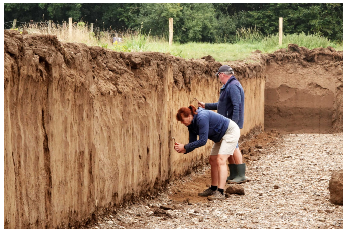
Opschonen van een wand

Het veldwerk dat we uitvoeren is vaak handmatig. Consortium Grensmaas heeft een profiel met de graafwerkzaamheden bloot gelegd. Met vrijwilligers gaan we met scheppen en krabbers de wanden glad maken. Hierdoor komt het profiel zichtbaar en kunnen we verschillende lagen bekijken.