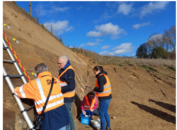
Monstername door Universiteit Aken

Vanuit de Universiteit Aken zijn er ook monsters genomen voor nader onderzoek. Door de bevindingen van alle onderzoeken te koppelen krijgen we een goed beeld van de oude Maaslopen.