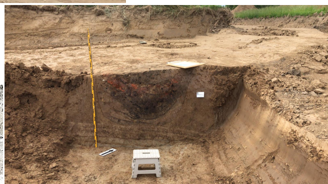
Een verkleuring in de bodem dat duidt op een grondspoor