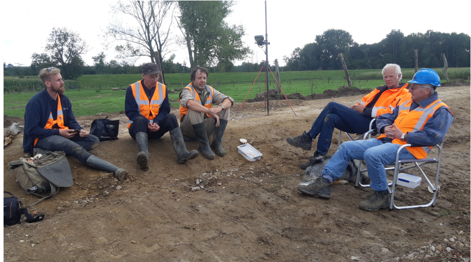
Medewerkers RCE en vrijwilligers

De Rijksdienst voor Cultureel Erfgoed is een paar dagen komen ondersteunen. Zij hebben diverse monsters meegenomen voor nader onderzoek. Tijdens de gesprekken hebben we veel van elkaar kunnen leren.