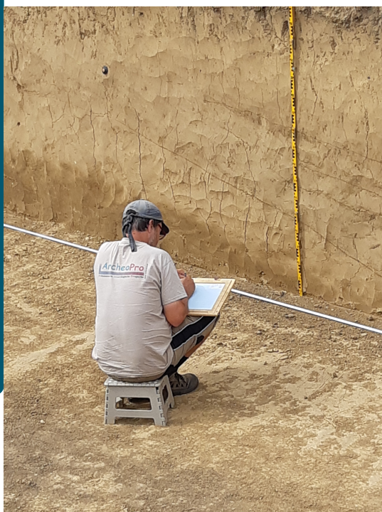
Archeoloog beschrijft het profiel

De archeoloog legt alles ook analoog vast. Beschrijft de profielen, de vondsten, de monsternames en de bodemopbouw nauwkeurig.