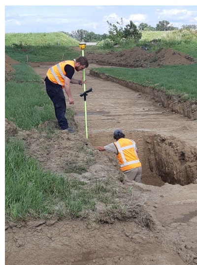
Landmeter meet het profiel in

De landmeter legt de exacte locatie van vondsten en profielen vast. De X,Y en Z coördinaten zodat we later precies weten waar iets gevonden of bevonden is.