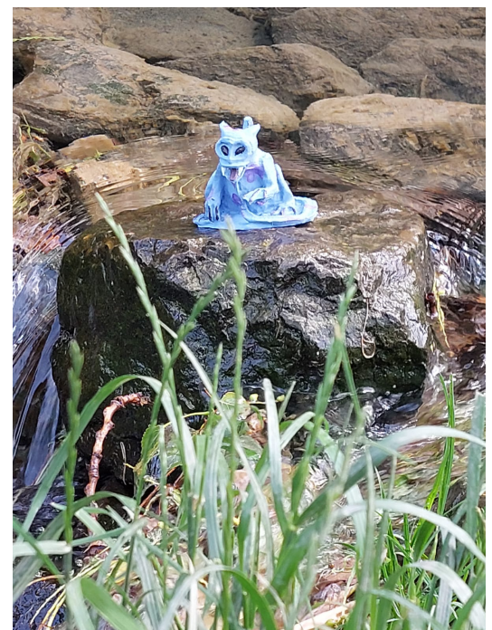
Maasmonster dat ontsnapt was. Kinderactiviteit juni 2023

Tijdens de Nationale Archeologiedagen in juni organiseren we wederom een archeologische activiteit. Een werkgroep is hiermee bezig. Een uitnodiging volgt nog.