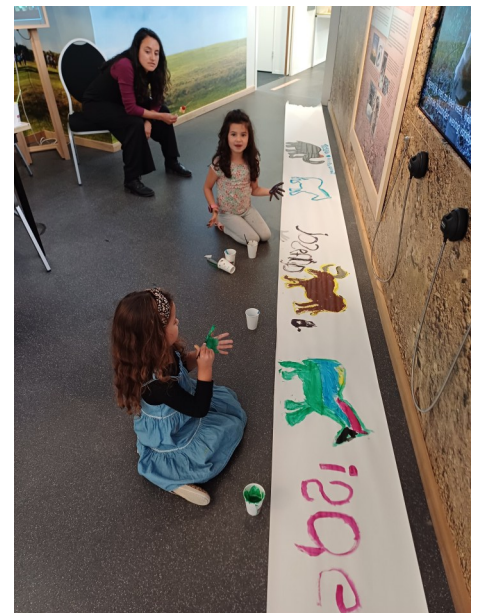
Impressie van de knustelmiddag tijdens de Nationale Archeologiedagen 2024