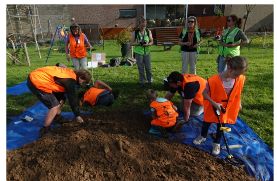
Impressie van de graafdagen