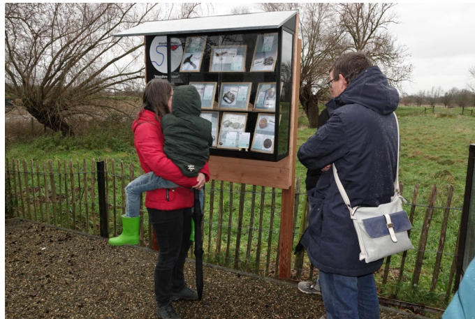
De Minitontoonstelling in Maasband met uitleg over de vondsten uit de nevengeul.

Heb je nog mooie foto's of verhalen die je kan delen met het project, stuur ons een mail. Wij zijn bijzonder geïnteresseerd in jouw verhaal.