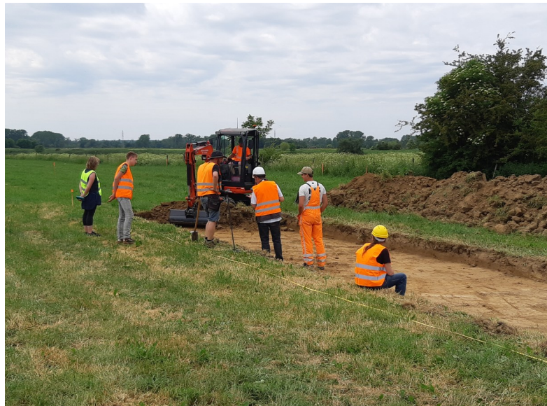
Graafdag in het veld

Dank aan alle vrijwilligers die van ons project een succes maken.