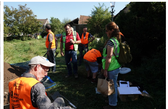
Impressie van de graafdagen