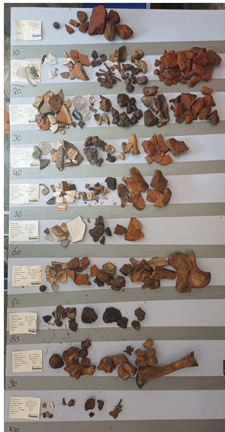
Vondsten uit een put blijken uit een afvalput te komen

Zodra hier meer over bekend is laten we dit weten!